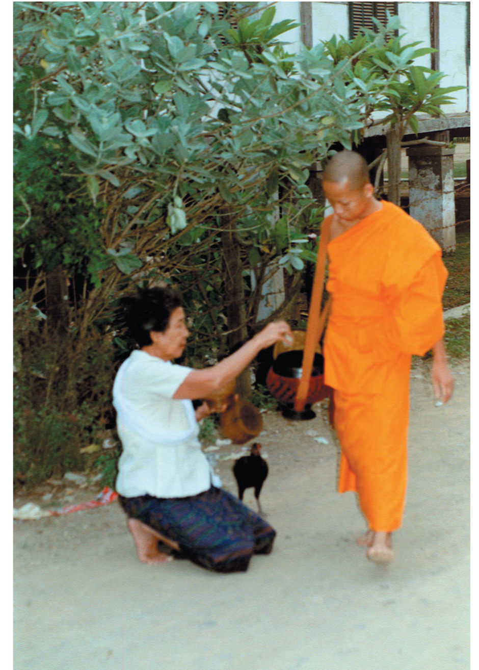
Tous les matins, au lever du soleil, les moines partent mendier leur nourriture de la journée. Les fidèles, des femmes pour la plupart leur ont préparé du riz qu'elles distribuent à raison d'environ une poignée chacun.