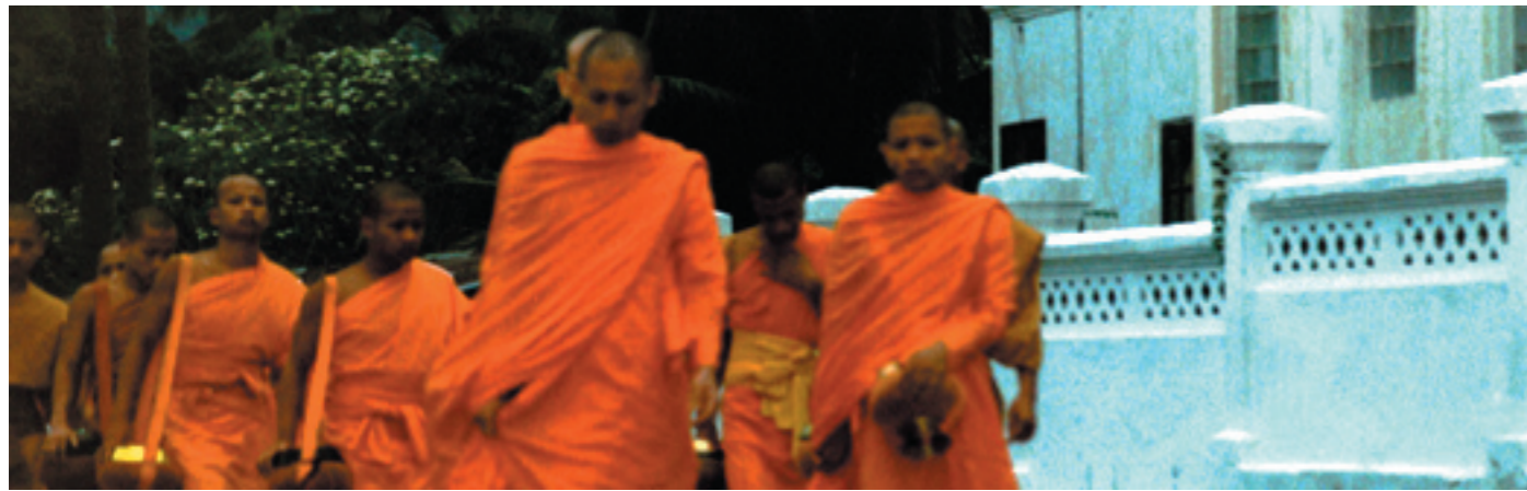
Angkor à vélo et le pays des Kmers.....